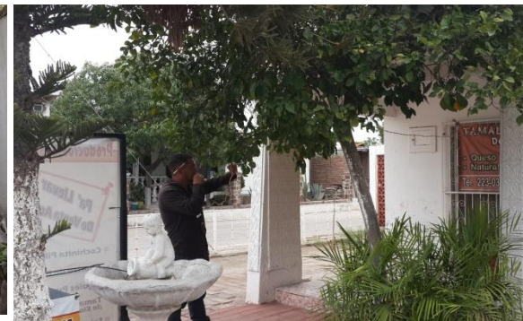
Control de focos de infestación del psílido en zonas urbanas por brigadas de los OASV.