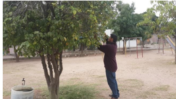
Colecta de adultos de psíldos para su envío y diagnósticos de HLB.

Control químico. Con la finalidad de reducir la diseminación del HLB, se estableció un esquema de manejo regional del psílido asiático de los cítricos, a través de tres Áreas Regionales de Control (ARCOs) 2 , para el caso sonora se tienen establecidos dos periodos de control regional en el total de huertos ubicados en las tres ARCO's la cual es realizada con recursos del productor (febrero y septiembre), posterior el control se realiza en focos localizados, además brigadas de los OASV, realizan el control en la zona urbana, buscando el impacto en los niveles poblacionales del insecto vector.