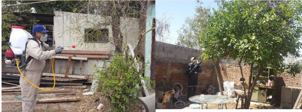
Control de focos de infestación del psílido en zonas urbanas por brigadas de los OASV.

SENASICA SERVICIO NACIONAL DE SANIDAD, INOCUIDAD Y CALIDAD AGROALIMENTARIA