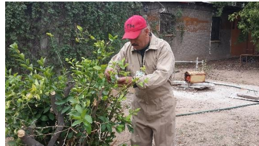
Colecta de adultos de psíldos para su envío y diagnósticos de HLB.

Control químico. Con la finalidad de reducir la diseminación del HLB, se estableció un esquema de manejo regional del psílido asiático de los cítricos, a través de tres Áreas Regionales de Control (ARCOs) 2 , para el caso sonora se tienen establecidos dos periodos de control regional en el total de huertos ubicados en las tres ARCO's la cual es realizada con recursos del productor (febrero y septiembre), posterior el control se realiza en focos localizados, además brigadas de los OASV, realizan el control en la zona urbana, buscando el impacto en los niveles poblacionales del insecto vector.