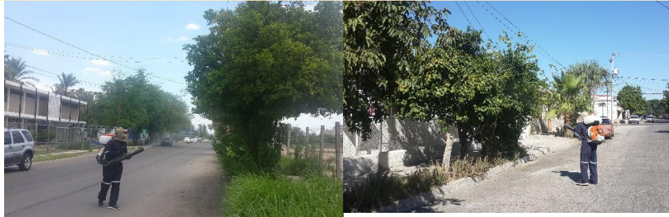
Control de focos de infestación del psílido en zonas urbanas por brigadas de los OASV.

SENASICA SERVICIO NACIONAL DE SANIDAD, INOCUIDAD Y CALIDAD AGROALIMENTARIA