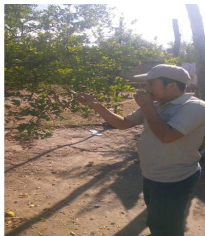
Colecta de adultos de psíldos para su envío y diagnósticos de HLB.

Control químico. Con la finalidad de reducir la diseminación del HLB, se estableció un esquema de manejo regional del psílido asiático de los cítricos, a través de tres Áreas Regionales de Control (ARCOs) 2 , para el caso Sonora se tienen establecidos dos periodos de control regional en el total de huertos ubicados en las tres ARCO's la cual es realizada con recursos del productor (febrero y septiembre), posterior el control se realiza en focos localizados, además brigadas de los OASV, realizan el control en la zona urbana, buscando el impacto en los niveles poblacionales del insecto vector.