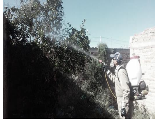
Control de focos de infestación del psíldos en zonas urbanas por brigadas de los OASV.