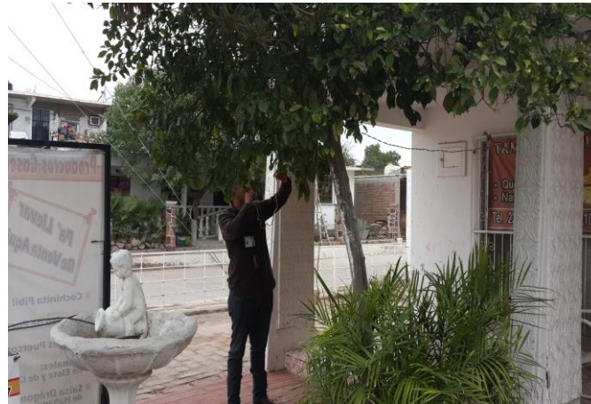
Colecta de adultos de psíidos para su envío y diagnósticos de HLB.

Control químico. Con la finalidad de reducir la diseminación del HLB, se estableció un esquema de manejo regional del psílido asiático de los cítricos, a través de tres Áreas Regionales de Control (ARCOs) 1 , para el caso Sonora se tienen establecidos dos periodos de control regional en el total de huertos ubicados en las tres ARCO's la cual es realizada con recursos del productor (febrero y septiembre), posterior el control se realiza en focos localizados, además brigadas de los OASV, realizan el control en la zona urbana, buscando el impacto en los niveles poblacionales del insecto vector.