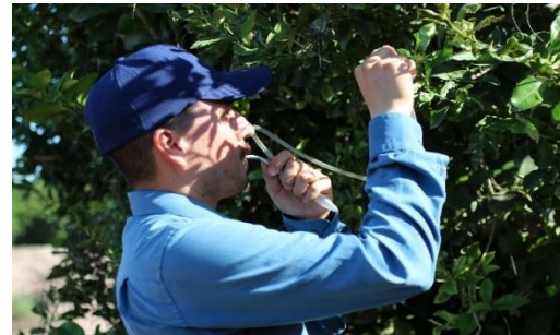
Colecta de adultos de psílicos para su envío y diagnósticos de HLB.

Control químico. Con la finalidad de reducir la diseminación del HLB, se estableció un esquema de manejo regional del psílido asiático de los cítricos, a través de tres Áreas Regionales de Control (ARCOs) 1 , para el caso Sonora se tienen establecidos dos periodos de control regional en el total de huertos ubicados en las tres ARCO's la cual es realizada con recursos del productor (febrero y septiembre), posterior el control se realiza en focos localizados, además brigadas de los OASV, realizan el control en la zona urbana, buscando el impacto en los niveles poblacionales del insecto vector.