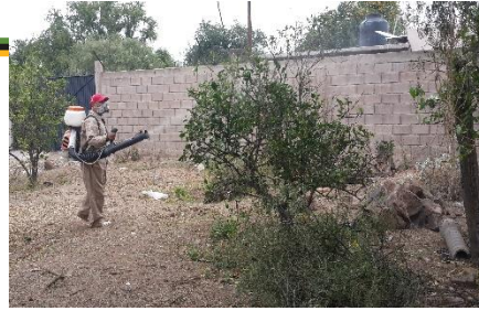
Control de focos de infestación del psíidos en zonas urbanas por brigadas de los OASV.