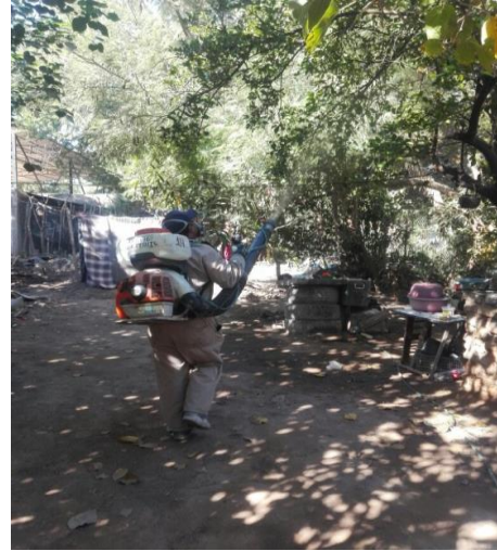
Control de focos de infestación del psíldos en zonas urbanas por brigadas de los OASV.