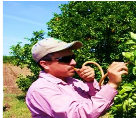
Colecta de adultos de psílicos para su envío y diagnósticos de HLB.

Control químico. Con la finalidad de reducir la diseminación del HLB, se estableció un esquema de manejo regional del psílido asiático de los cítricos, a través de tres Áreas Regionales de Control (ARCOs) 1 , para el caso Sonora se tienen establecidos dos periodos de control regional en el total de huertos ubicados en las tres ARCO's la cual es realizada con recursos del productor (febrero y septiembre), posterior el control se realiza en focos localizados, además brigadas de los OASV, realizan el control en la zona urbana, buscando el impacto en los niveles poblacionales del insecto vector.