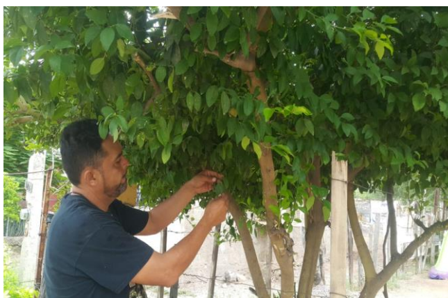
Colecta de adultos de psílicos para su envío y diagnósticos de HLB.

Control químico. Con la finalidad de reducir la diseminación del HLB, se estableció un esquema de manejo regional del psílido asiático de los cítricos, a través de tres Áreas Regionales de Control (ARCOs) 1 , para el caso Sonora se tienen establecidos dos periodos de control regional en el total de huertos ubicados en las tres ARCO's la cual es realizada con recursos del productor (febrero y septiembre), posterior el control se realiza en focos localizados, además brigadas de los OASV, realizan el control en la zona urbana, buscando el impacto en los niveles poblacionales del insecto vector.