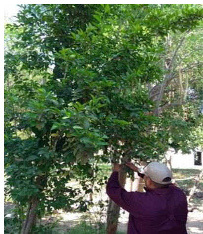
Colecta de adultos de psílicos para su envío y diagnósticos de HLB.

Control químico. Con la finalidad de reducir la diseminación del HLB, se estableció un esquema de manejo regional del psílido asiático de los cítricos, a través de tres Áreas Regionales de Control (ARCOs) 1 , para el caso Sonora se tienen establecidos dos periodos de control regional en el total de huertos ubicados en las tres ARCO's la cual es realizada con recursos del productor (febrero y septiembre), posterior el control se realiza en focos localizados, además brigadas de los OASV, realizan el control en la zona urbana, buscando el impacto en los niveles poblacionales del insecto vector.