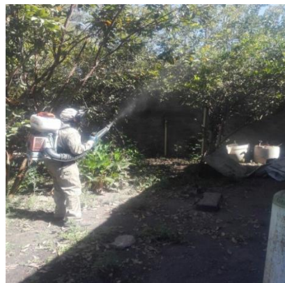
Control de focos de infestación del psíldos en zonas urbanas por brigadas de los OASV.