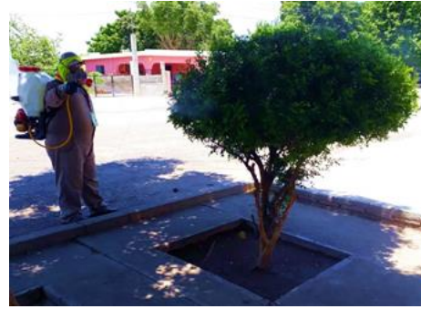
Control de focos de infestación del psílidos en zonas urbanas por brigadas de los OASV.