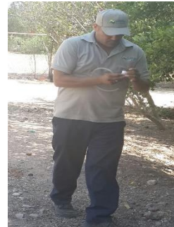
Colecta de adultos de psílicos para su envío y diagnósticos de HLB.

Control químico. Con la finalidad de reducir la diseminación del HLB, se estableció un esquema de manejo regional del psílido asiático de los cítricos, a través de tres Áreas Regionales de Control (ARCOs) 1 , para el caso Sonora se tienen establecidos dos periodos de control regional en el total de huertos ubicados en las tres ARCO's la cual es realizada con recursos del productor (febrero y septiembre), posterior el control se realiza en focos localizados, además brigadas de los OASV, realizan el control en la zona urbana, buscando el impacto en los niveles poblacionales del insecto vector.