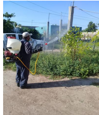
Control de focos de infestación del psílidos en zonas urbanas por brigadas de los OASV.