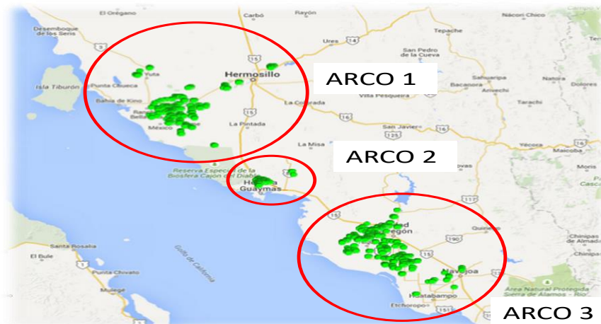
Ubicación de las tres Áreas Regionales de Control o ARCOs en Sonora.

Monitoreo. Se revisaron un total de 79 huertos comerciales en 1,580 trampas instaladas para la detección de adultos de Diaphorina citri . En el mes de octubre se tuvo un nivel de infestación de 0.37 psílidos/trampa en 3000 trampas revisadas, se localizaron 1,095 adultos de Diaphorina citri en 331 trampas.