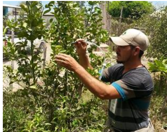
Colecta de adultos de psílicos para su envío y diagnósticos de HLB.

Control químico. Con la finalidad de reducir la diseminación del HLB, se estableció un esquema de manejo regional del psílido asiático de los cítricos, a través de tres Áreas Regionales de Control (ARCOs) 1 , para el caso Sonora se tienen establecidos dos periodos de control regional en el total de huertos ubicados en las tres ARCO's la cual es realizada con recursos del productor (febrero y septiembre), posterior el control se realiza en focos localizados, además brigadas de los OASV, realizan el control en la zona urbana, buscando el impacto en los niveles poblacionales del insecto vector.