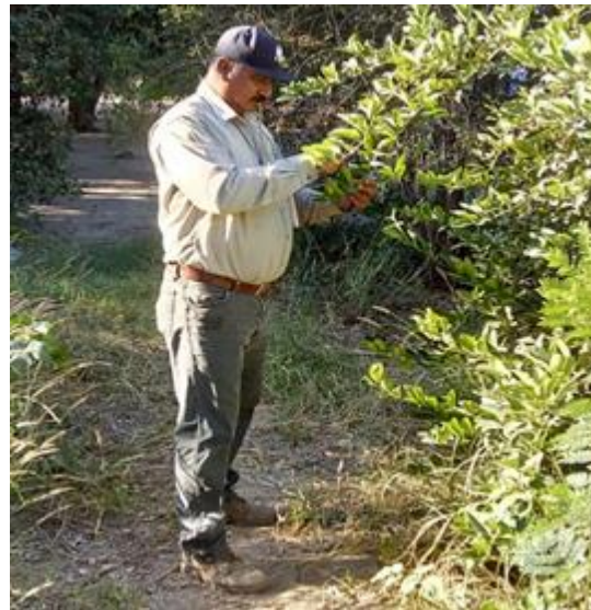
Colecta de adultos de psíldos para su envío y diagnósticos de HLB.

Control químico. Con la finalidad de reducir la diseminación del HLB, se estableció un esquema de manejo regional del psílido asiático de los cítricos, a través de tres Áreas Regionales de Control (ARCOs) 1 , para el caso Sonora se tienen establecidos dos periodos de control regional en el total de huertos ubicados en las tres ARCO's la cual es realizada con recursos del productor (febrero y septiembre), posterior el control se realiza en focos localizados, además brigadas de los OASV, realizan el control en la zona urbana, buscando el impacto en los niveles poblacionales del insecto vector.