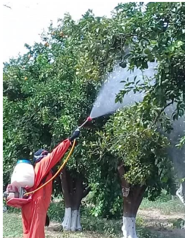
Fig.- Control Químico del acaro vector radio 40 m.

A la fecha se lleva un avance de cuatro aplicaciones contra el acaro vector Brevipalpus spp en un radio de 40 m.; se mantendrá este punto positivo a la enfermedad como foco rojo y se volverá a realizar exploración a las 12 semanas como lo indica el manual operativo.