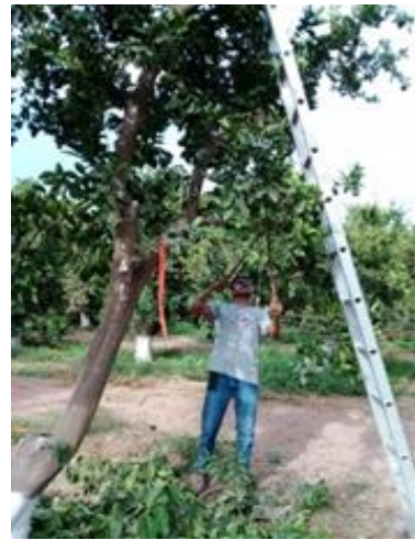
Fig.2 Poda ligera del árbol positivo a leptosis (CiLV C)